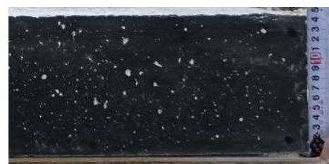
棒状バイブレータ使用側面