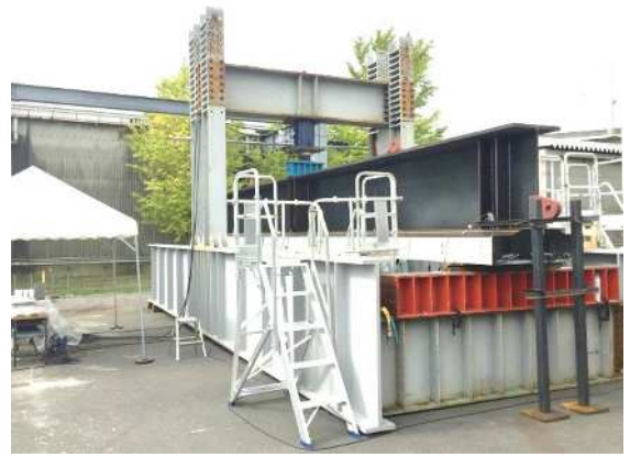
負曲げ載荷試験 (門型載荷試験台 最大荷重3,920kN)