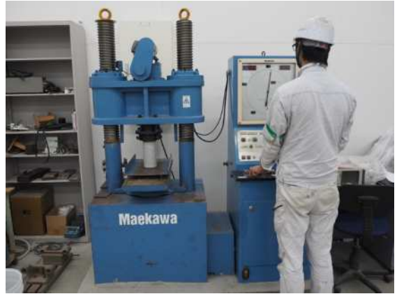
圧縮強度試験機 (最大荷重2,000kN)