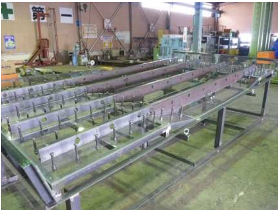
充填性確認実験 アクリル試験体製作