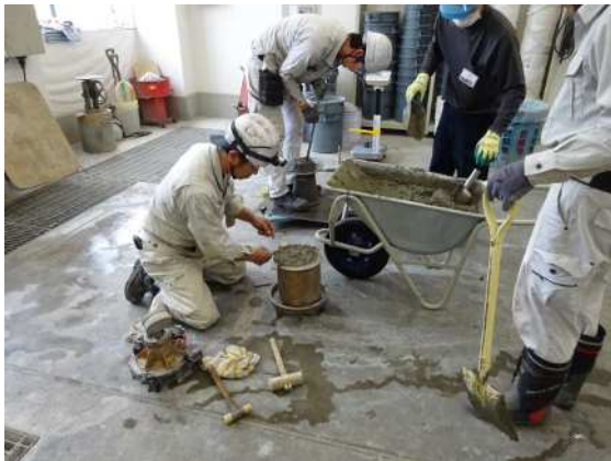
コンクリート配合(調合)選定試験