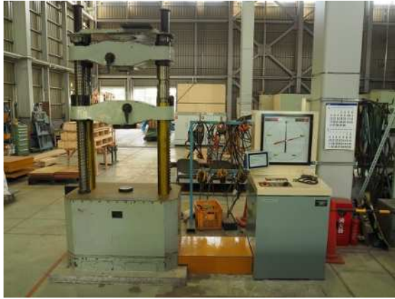
万能試験装置 (最大荷重1,000kN)