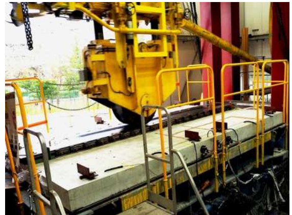
輪荷重走行疲労試験(最大荷重490kN)