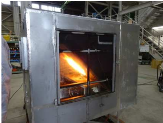
延焼性試験(首都高,NEXCO)