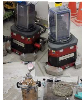
フレッシュ性状試験(電磁加振試験)