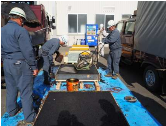
道路舗装試験体製作