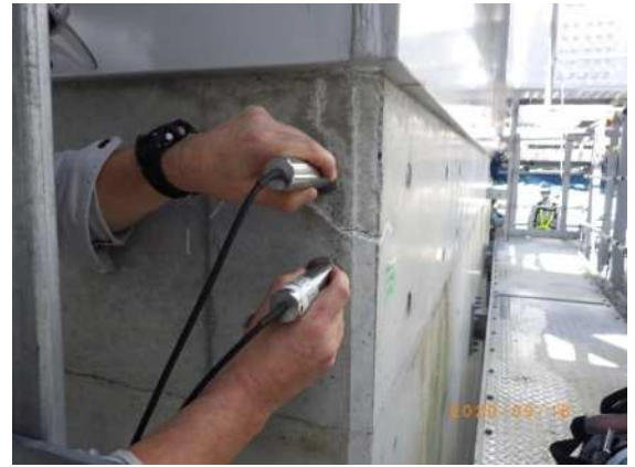
ひび割れ深さ測定