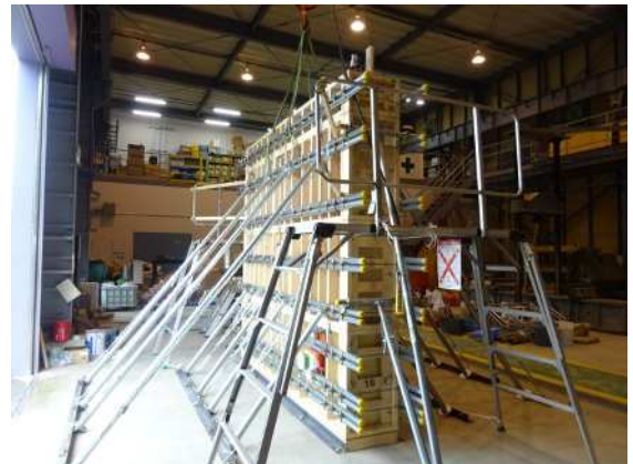
充填圧力計測実験 大型木製試験体製作