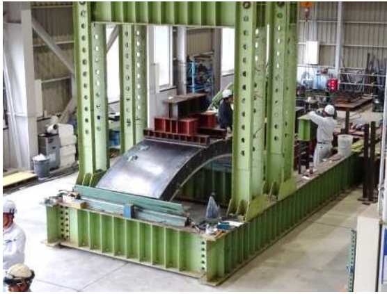
円弧試験体曲げ試験 (門型載荷試験台 最大荷重1,960kN)